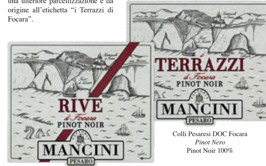
Colli Pesaresi DOC Focara Pinot Nero Pinot Noir 100%

I “CRU” di Rive. A rappresentare la miglior espressione del Pinot Nero coltivato sulla scogliera di Focara, dalla vendemmia 2007 la Vigna di Rive Monte viene vinificata separatamente dagli altri vigneti e imbottigliata con l’etichetta “Rive”. Pur di piccole dimensioni, il vigneto presenta tre zone che maturano in tempi diversi, con il versante occidentale che consente maturazioni più lunghe e produce un vino di maggiore struttura. Nelle grandi annate questa zona merita una ulteriore parcellizzazione e dà origine all’etichetta “i Terrazzi di Focara”.