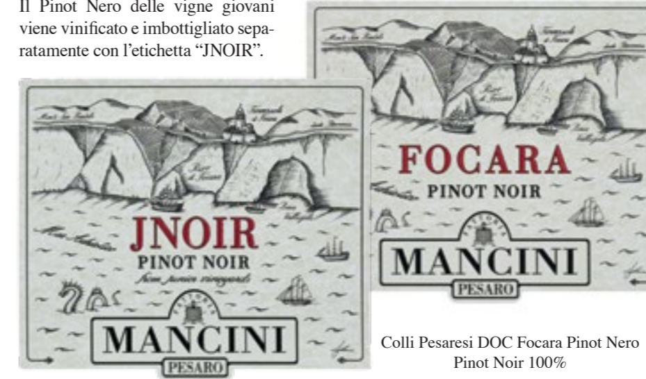
Colli Pesaresi DOC Focara Pinot Nero Pinot Noir 100%

Il Pinot Nero delle vigne giovani viene vinificato e imbottigliato separatamente con l'etichetta "JNOIR".