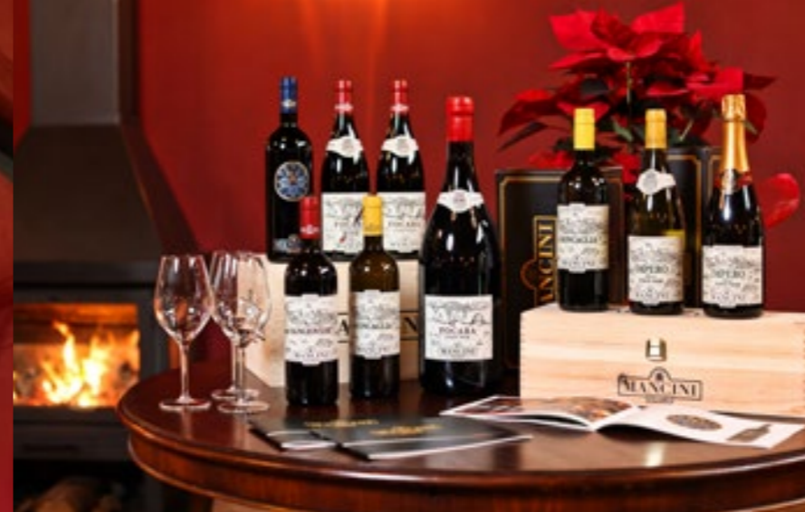
Lo Spaccio Aziendale