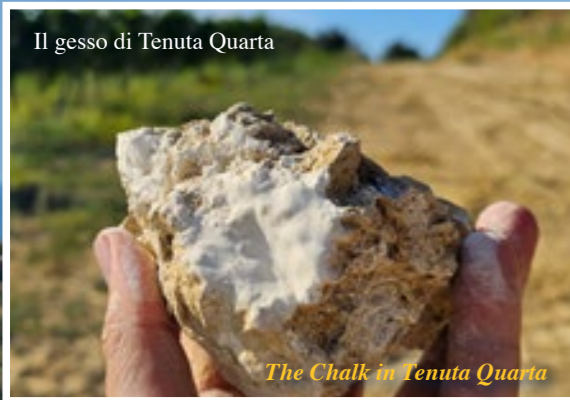
The Chalk in Tenuta Quarta