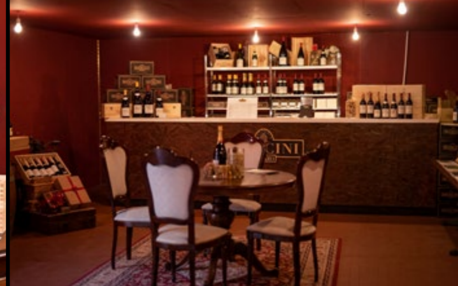
The Winery Shop